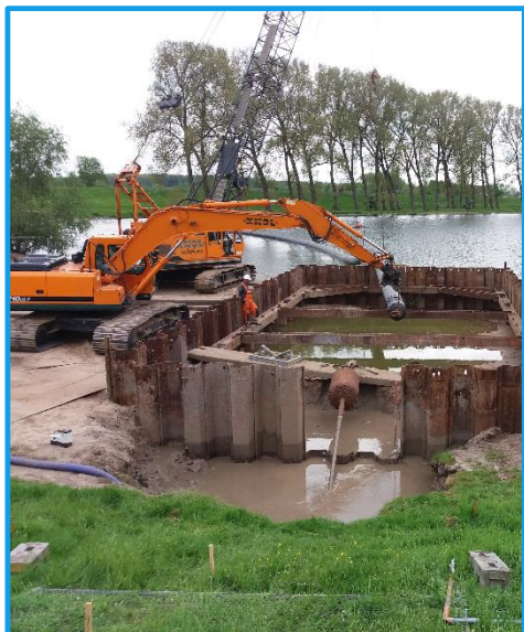
persbuis onder dijk

Na de vakantie is gestart met het aanbrengen van roosters, pompschachten en toegangsluiken en is de bouwkuip ontmanteld. De ruimte rond de instroomkelder is aangevuld met zand. Rond 20 september zijn de pompen geplaatst en worden kabels getrokken naar de bedieningskast. De komende tijd brengen we het uitstroomwerk in de watergang aan en ronden we de aansluitingen van de persleiding af. Daarna wordt de terreinverharding aangelegd en de elektrotechnische zaken geïnstalleerd en getest.