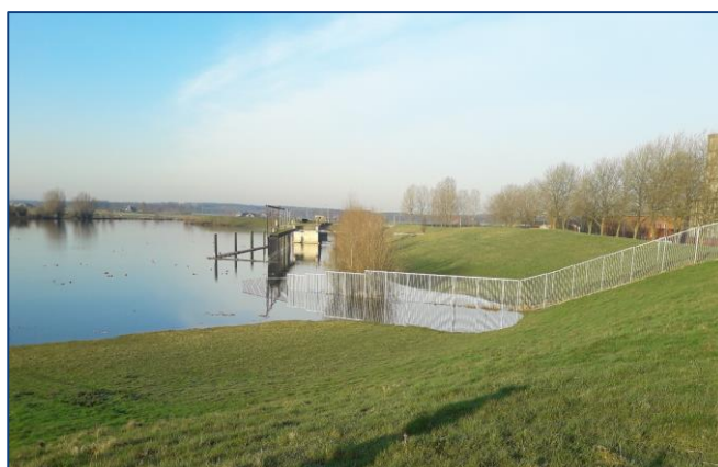
Locatie nieuw gemaal nabij hekwerk.

U kunt de ontwikkelingen van ons project op de voet volgen door de (gratis) BouwApp te installeren op uw smartphone of tablet. Deze 'De BouwApp' kunt u in de App Store downloaden. Na de installatie zoekt u naar Gemaal Harculo. Voeg het project toe aan favorieten en u ontvangt bij elke nieuwe update een berichtje.